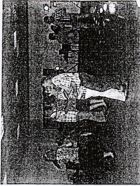
Le comité des fêtes a mis les petits plats dans les grands pour ce repas dansant organisé samedi 10 octobre.

Un nouveau rendez-vous réussi pour le comité des fêtes, samedi soir, à la salle Alfred Plessier. Pas moins de 70 gourmands avaient répondu à son invitation pour un dîner dansant qui a tenu toutes ses promesses.